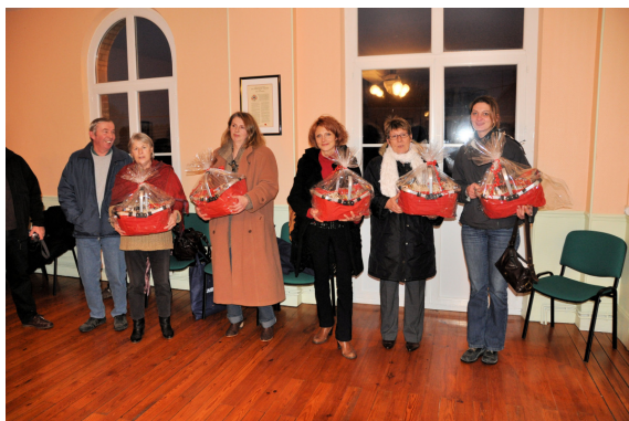
Noël 2010 des employés communaux