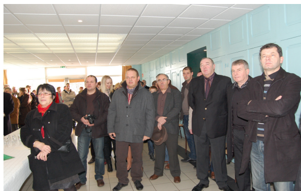
Cérémonie des vœux 2011