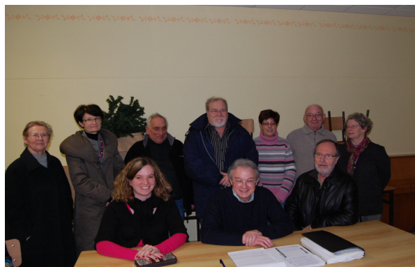
Assemblée Générale 2011 Ass. Lire à Cugny