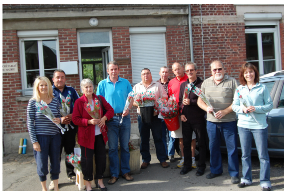
Distribution de Roses aux Dames de la commune