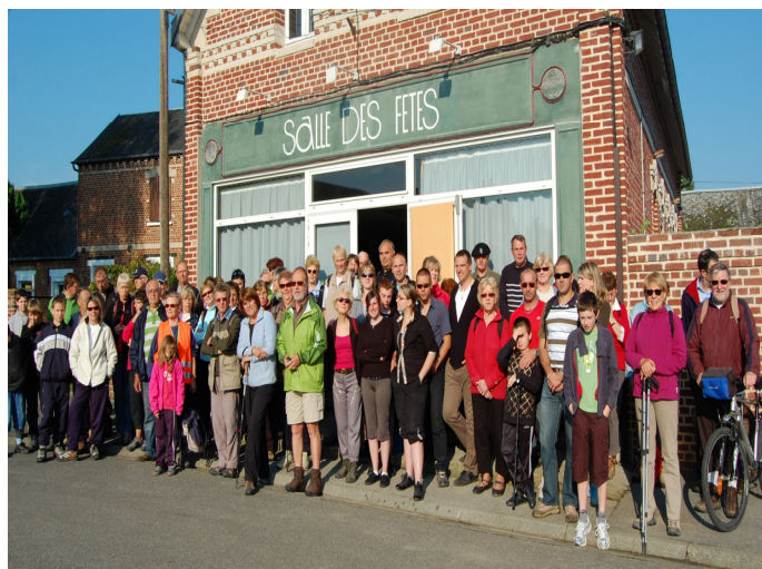
Les participants, avant le départ, de la rando du muguet 2011